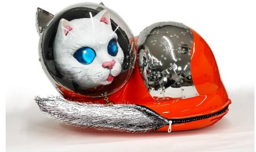
ヤノベケンジ 「SHIP'S CAT Mofumofu22」