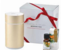
アロマミニゴールドギフト/ ¥8,640

期間中、税込5,400円以上ご購入のお客様にシアバターのリップバームをプレゼント。