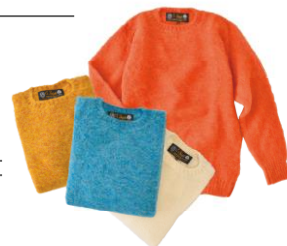
CE FORSYTHY / シャギードックセーター ¥19,224